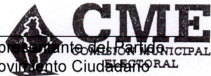
Representante del Partido Movimiento Ciudadano